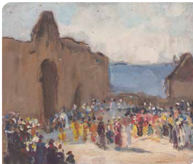
Illustration : Procession à la Porte des Tours, huile sur panneau, collection fonds d'atelier de Lucien de Maleville, numéro d'inventaire FRLDM001_B_1_1_3_1_13

Local-atelier : 9 rue Pontcarral asso@lucierendemaleville.org www.lucierendemaleville.org