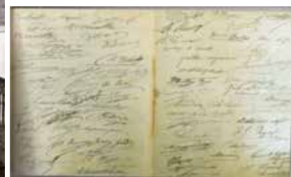
Pétition adressée au Préfet de la Dordogne en 1903