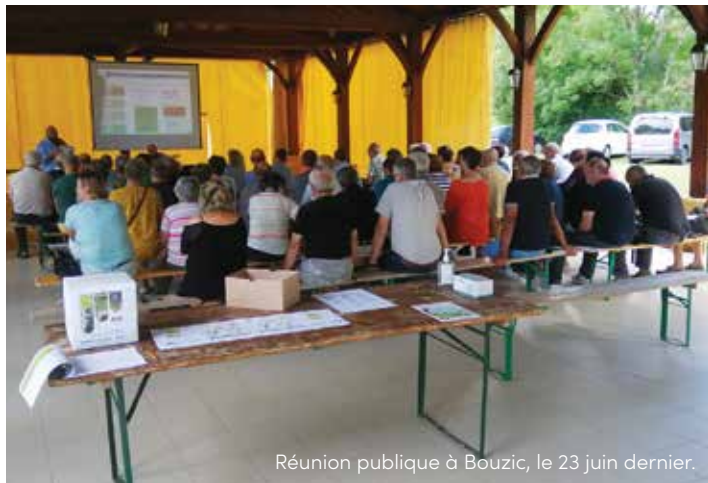
Réunion publique à Bouzic, le 23 juin dernier.

Pendant deux mois, le bureau d'études Karthéo a sillonné le territoire pour rencontrer élus et habitants.