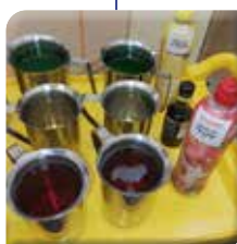
Semaine du goût