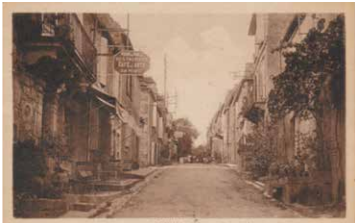
Vues du bas de la Grand'Rue et de la Place de la Halle