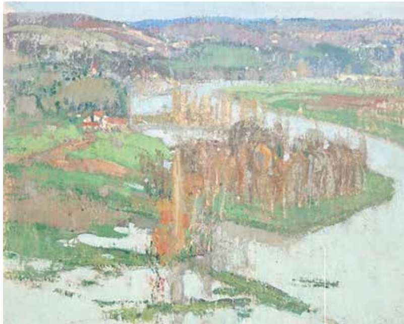
L'inondation à Cénac , étude, 1959, huile sur panneau, 33 x 40 cm, coll. part.

l'intempérie, Maleville oppose un « arrêt sur image » qui permet de dépasser l'émotion provoquée par le paysage dévasté pour percevoir la constance du mouvement et de l'écoulement de la rivière. Notre prochain rendez-vous sera l'assemblée générale de l'association, le 21 avril à 17h30 salle de la Rode.